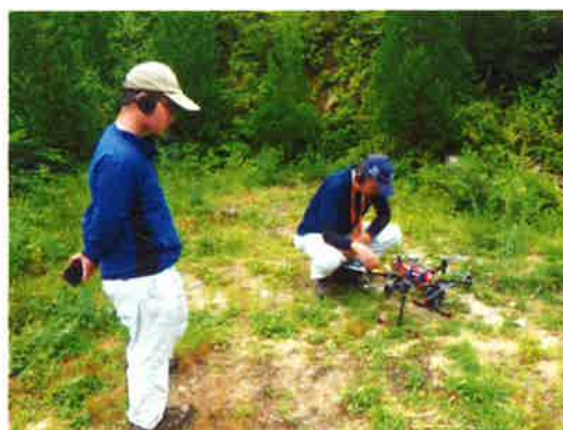
▲ ドローンの飛行実験に集中！