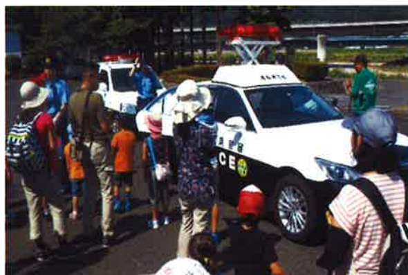
▲ 鳥取県警察にも御来場いただき、交通安全の啓発を行っていただきました。