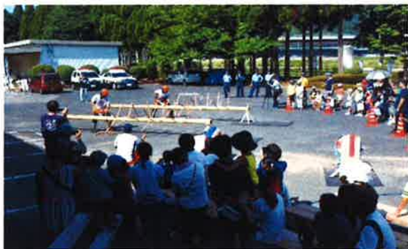
▲オープニングでは、伐木のプロフェッショナルが、丸太伐りや枝払い実演を行いました。