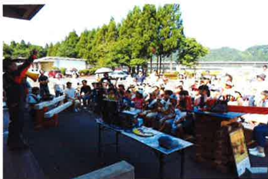
▲じゃんけん大会で盛り上がりました。