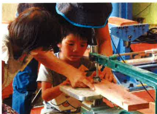
▲ 木工品をつくろう