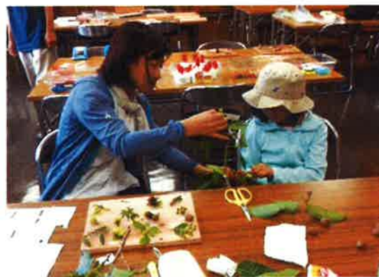
▲ 森の木々で標本をつくろう