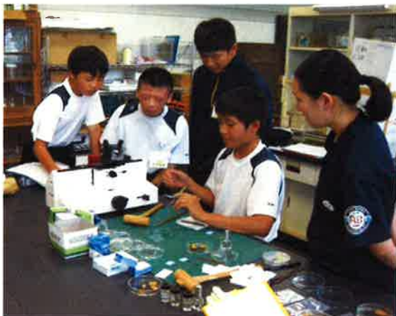
▲ 顕微鏡観察用のプレパラート作り