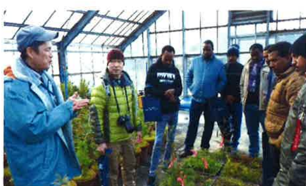
▲ 鳥取大学の留学生のみなさん