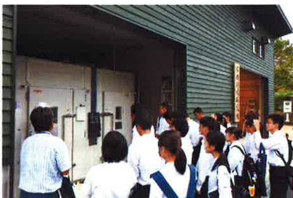
▲ 試験研究の施設を熱心に見学